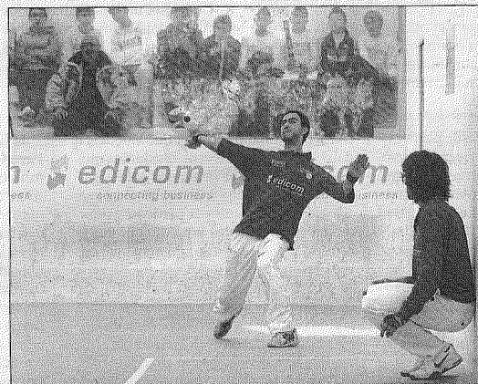
La Horta Nord es un vivero de jugadores de todas categorías.