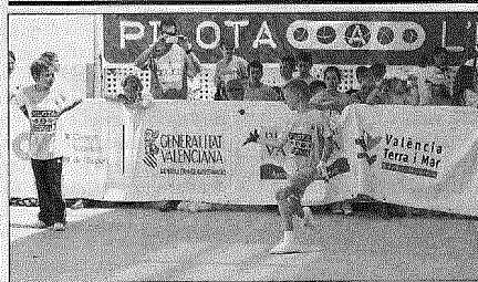
Pilota a l'Escola. F.P.V.

■ El Autnómico de Raspall Parejas, trofeo Diputación de Valencia, afronta mañana su sexta jornada, con interesantes partidas en su categoría absoluta. Genoves A recibe al Castelló de Rugat, los primeros luchando por el liderato, los segundos por reducir distancias, 4 puntos les separan. Xeraco, en tercera posición, visitará a la Llosa de Ranés, equipo con problemas, que quiere mantener sus opciones de jugar las semifinales. Mientras que el vigente campeón, Bicorp, descansará esta jornada. F.P.V.