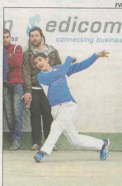
Quart de les Valls, en semifinales.

Estos clubes forman parte de los clásicos en la lucha por el título en casi cualquier competición en la cual participen. No en balde, Massalfassar es el claro dominador de esta competición, con trece trofeos de campeón. Siendo los del Camp de Morvedre los videntes subcampeones del torneo, así como finalistas del Autonómico en tres ocasiones en los