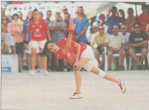
Beniparrell lucha por el Raspall parejas. F.P.V.

final, así como los emparejamientos de semifinales, todavía queda a expensas de la última jornada, que tendrá lugar este fin de semana.